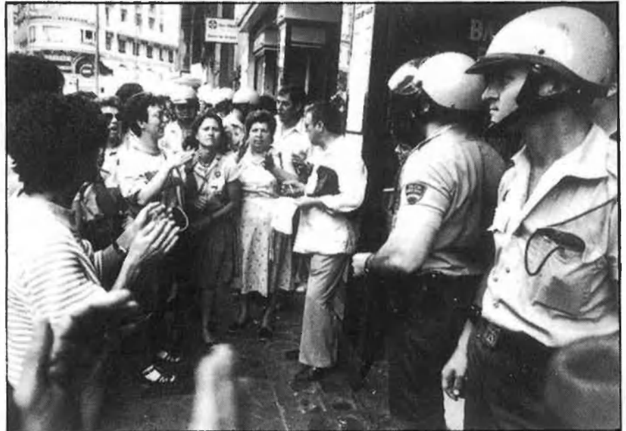
La protesta ciutadana s'ha convertit en el mètode més directe i eficaç.

Els títols de viatges són un privilegi adquirit pels ferroviaris. Provenen d'un antic decret franquista del Ministeri d'Obres Públiques. Els títols permeten als treballadors de Renfe viatjar en els trens de rodalies sense límit i, en els de llarg recorregut, fins a ocupar un màxim del 10 per cent de les places disponibles.