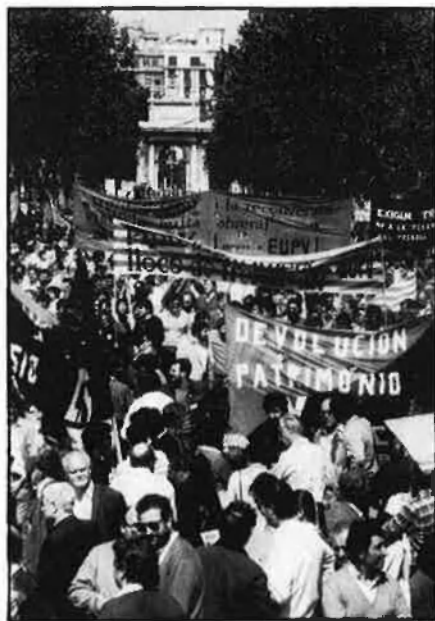
Aquest 1 de maig, més mobilitzacions que mai.

A questa primavera crema. La conflictivitat laboral durant el primer quadrimestre de l'any ha mobilitzat amb més o menys continuïtat, la major part dels sectors productius de l'Estat espanyol. A més, han coincidit en el temps les vagues i aturades de diversos col·lectius de treballadors, com ara la sanitat pública, el transport, la construcció o el metall, amb l'eixida al carrer de centenars de milers d'estudiants d'ensenyament mitjà i de nivell universitari, la qual cosa ha fet que molts dies