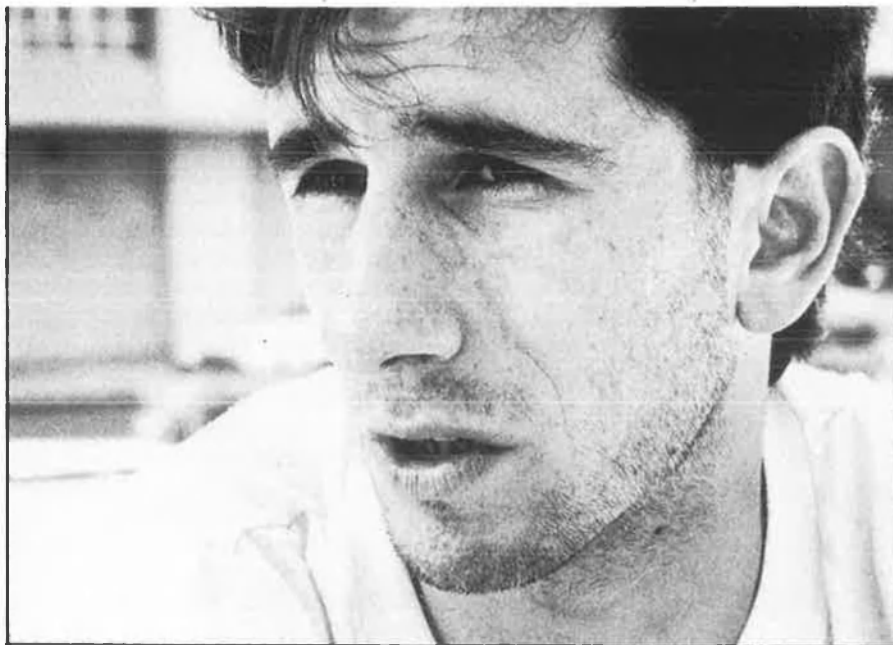
Aspar: «Realment s'ha d'estar boig per a córrer els grans premis amb la misèria que es cobra».