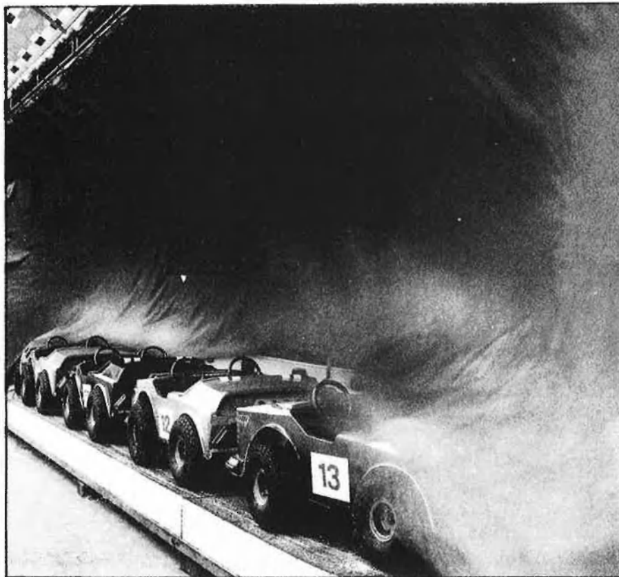
El parc d'atraccions vist per Manel Úbeda.

han entès ells, al servei d'una idea que han sabut transmetre amb intel·ligència i selectivitat.