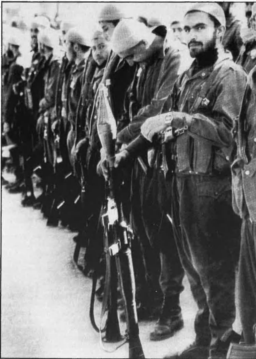
Alguns teòrics ja parlen de «la tercera expansió de l'Islam».

estan esdevenint els segons financers del món a poca distància d'occident. Que han llançat satèl·lits espacials. Que han creat sistemes informàtics completament en àrab, impermeables a l'anglès. Són dues cares d'una mateixa moneda. La moneda que representa la creença cega en el futur d'una religió, d'una comunitat humana i social, d'un sistema polític. Segurament sí que són fanàtics. Però està per veure si això és una desqualificació.