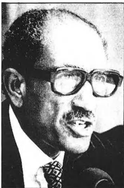
Sadat, president d'Egipte.

E ls musulmans ja són més de cinc-cents milions. D'ells tot just uns dos-cents milions d'àrabs. L'URSS compta amb repúbliques oficialment islàmiques. Austràlia viu un insòlit fenomen d'islamització causat pels emigrants del sud-est asiàtic. En el continent africà l'Islam