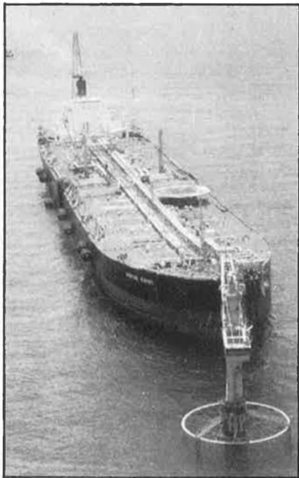
Superpetrolier a l'Egeu.

Quan a mitjan dècada dels seixanta l'URSS començà a crear i a escampar