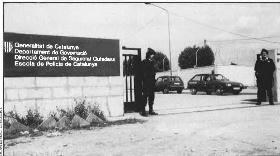
Guardar portes no ompli professionalment la policia.

El mosso té una bona preparació, i es pren el tema de la seguretat des d'una perspectiva progressista. Amb ganes de tirar endavant la policia de Catalunya. Han de trigar molt a produir-se les més mínimes corrupteles. «En el futur podrien produir-se situacions desagradables —segons Josep M. Bernat—, amb aquells que resulten més incontrolables: els 'mortadelos',