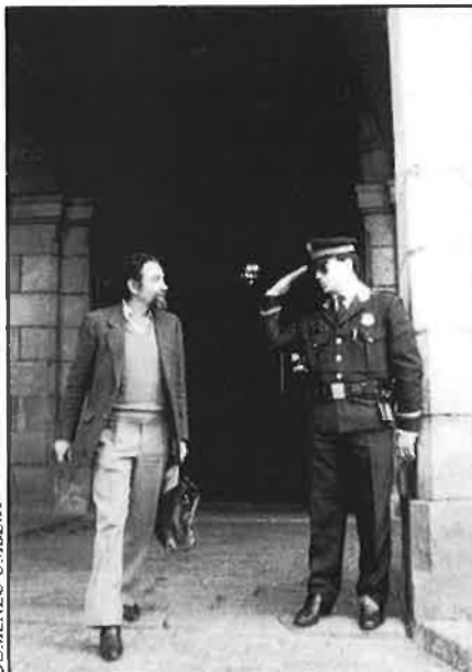
«100.000 pessetes per quaranta hores».

El SUME es va escindir de l'UPC al cap d'un temps. «Els, els del SUME, es preocupaven molt de la legalització i creien que els aspectes professionals i socials eren una pèrdua de temps. Nosaltres sabíem que la legalització tard o d'hora arribaria i preferíem treballar més en temes de formació, se-