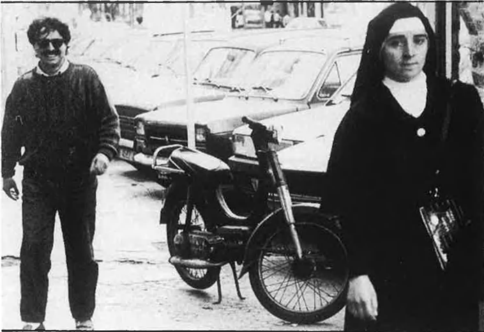
«No conec cap primera espasa de la literatura catalana que em tinga enveja».