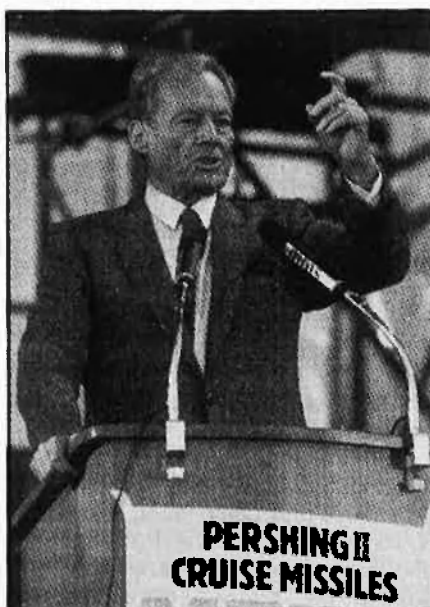
Premi Nobel de la Pau de 1971.

en president de l'SPD l'any 1964 i fou ministre d'Afers Exteriors del govern de la gran coalició encapçalada per Kiesinger l'any 1966. El 1969 fou proclamat canceller d'un govern de coalició liberals-SPD. Guanyà les eleccions del 1972, però dimití el 6 de maig del 1974 quan es descobrí que un dels seus ajudants personals Gunther Guillaume, era espia de l'Alemanya Democràtica. Brandt no ho sabia.