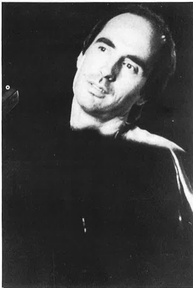
Lluís Llach és el cantant més votat.