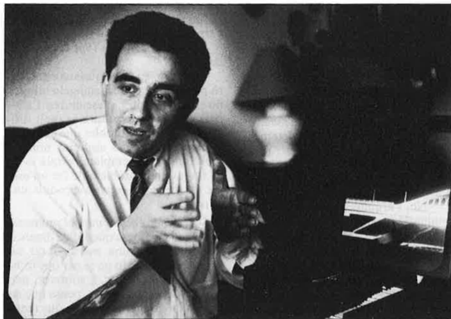
«Seria interessant tenir una crítica creativa, i no la crítica repetitiva i avorrida que tenim».

—El tema del riu és molt important per a la ciutat, evidentment, però probablement no és el més important. Ara, s'ha polititzat i és el cavall de batalla de determinats sectors de l'opinió pública valenciana. És ridícul que es gasten tantes energies en un tema que, sent un tema important, des del meu punt de vista no s'està portant tan malament. A la gent, mentre estarà entretinguda amb el riu, se li oblidaran altres problemes molt més clau per al futur urbanístic, com els passos a nivell, o la pol·lució, el problema de la ciutat de cara al mar, la recuperació de les zo-