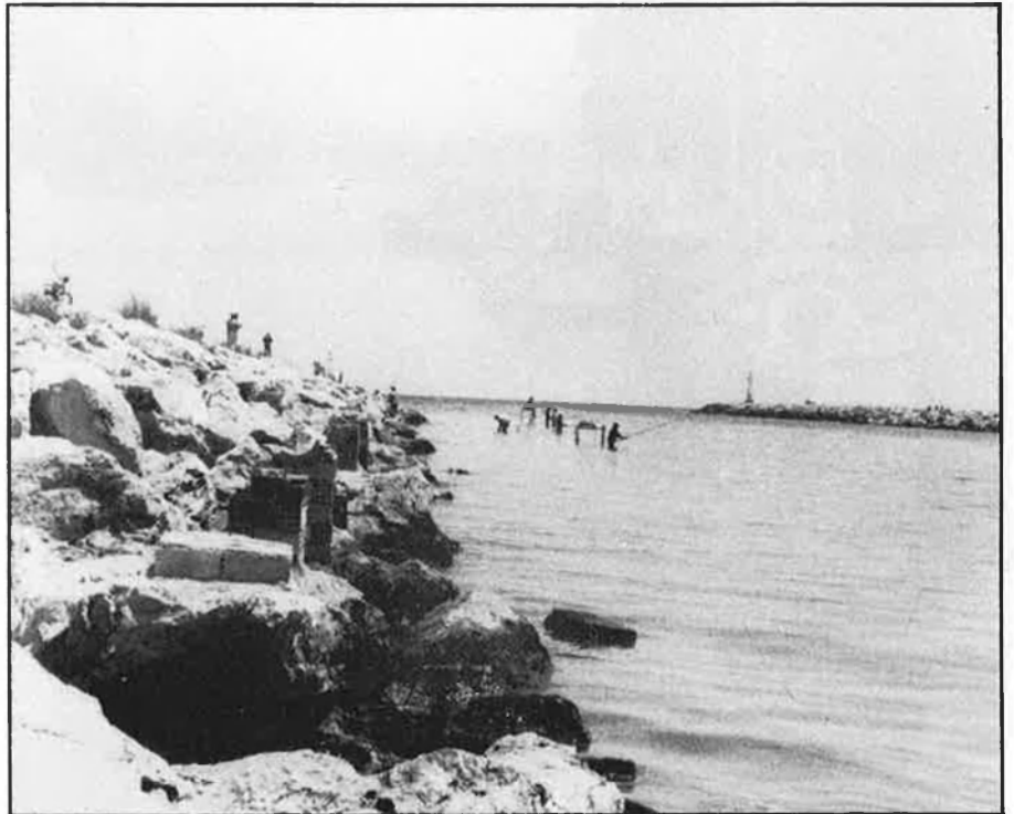
L'aigua es prendria de la mateixa desembocadura.

Els temes i els elements del conflicte són a la taula: poca aigua i molta demanda, uns drets històrics i uns inte-