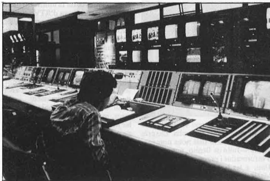
Sant Cugat ha perdut una altra oportunitat de guanyar audiència.