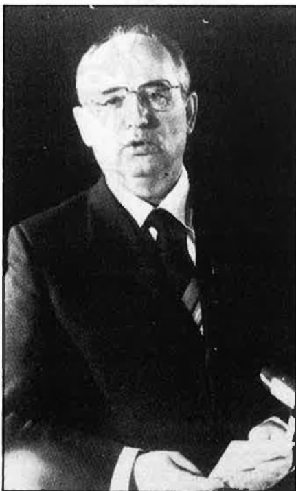
Gorbatxev desbloqueja les converses.

S i les coses van bé, el 1992 no serà només l'any de l'Olimpíada a Barcelona, l'any de la signatura de l'acta única europea, l'any del cinquè centenari de la matança dels indis