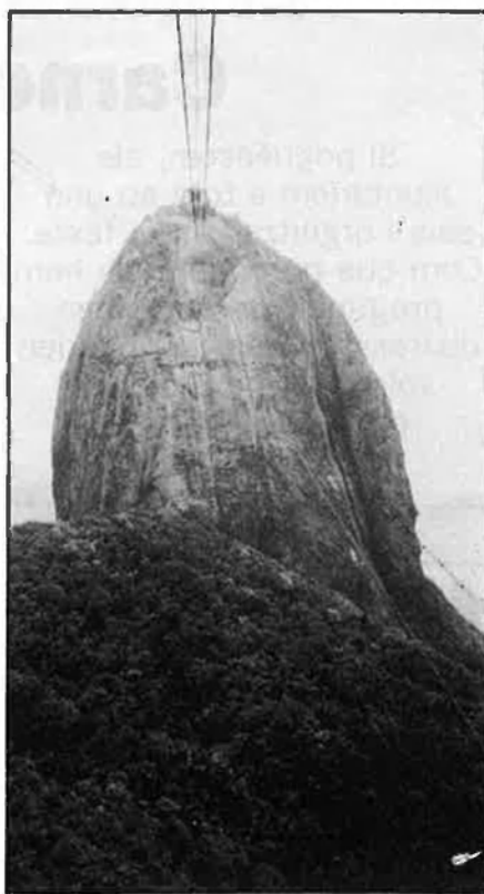
«Caipirinha», samba trepidant, bogeria del tròpic...

Això sí; tots, vencedors i vençuts, felços i desgraciats, s'expressen a ritme de samba. Amb panderetes, tamborinos, xiulets i maraques, les vísceres es