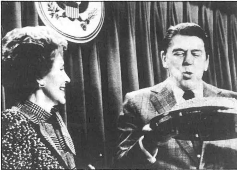
El passat dia 6 Reagan complí setanta-sis anys.

dria ser inclús que només ho fes per salvar la seua pell, a la vista dels anys de presó que podrien caure sobre mig CSN.