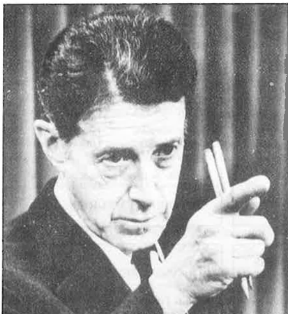
L'informe critica la inhibició de Weinberger.

No sembla que en un futur pròxim cap dels dos pugui veure's en perill. Weinberger, quan li passaren l'infor-