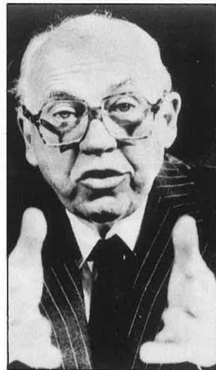
Dalt, Fawn Hall . Baix a l'esquerra, George Bush , que no ha estat afectat per l'informe, i George Shultz . A la dreta, William Casey , un malalt oportú.

Walsh és un prestigiós i persuasiu advocat d'Oklahoma City i té entre les seues ordres una de molt especial, que