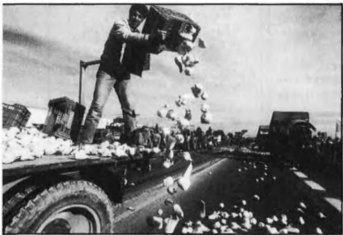
Dalt, llimons per terra en les carreteres d'Oriola. Baix, la Unió col·lapsa la pista de Silla.