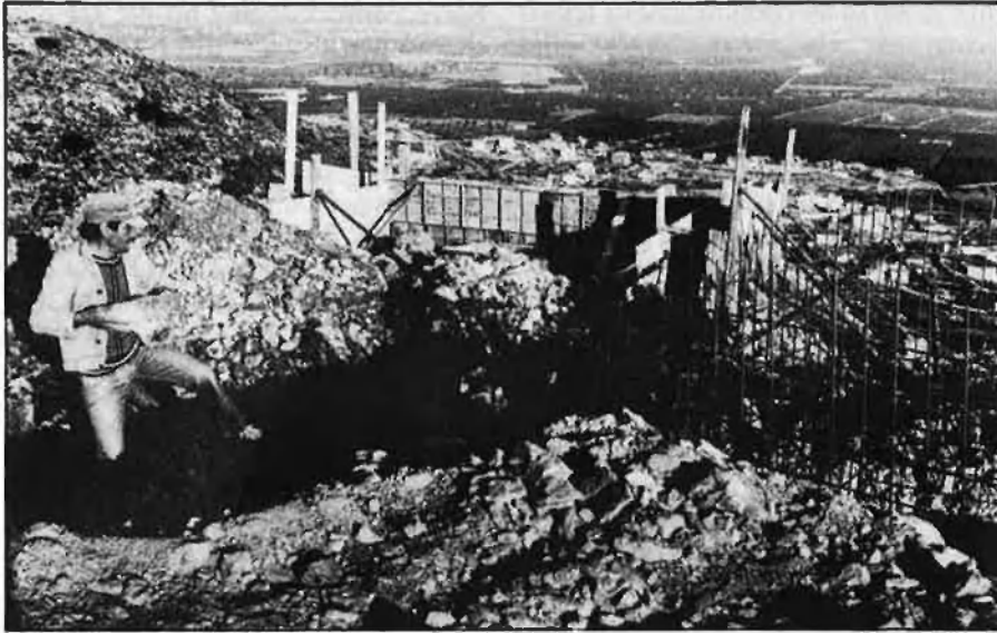
Obres del nou repetidor de TV3, a Xiva.

primer mapa de receptibilitat arreu del país, que assenyalen les zones d'ombra amb tots els detalls.