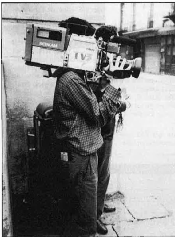
Les distintes televisions també tenen interès en arribar a tot arreu dels Països Catalans.

I un símptoma d'aquest canvi pot ser la publicitat d'una determinada marca d'ordinadors americans que, després d'una molt bona campanya en TV3, han començat a inserir anuncis en català en la premsa en castellà de