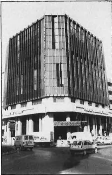
No totes les caixes han donat el resultat previst pel partit en el poder.