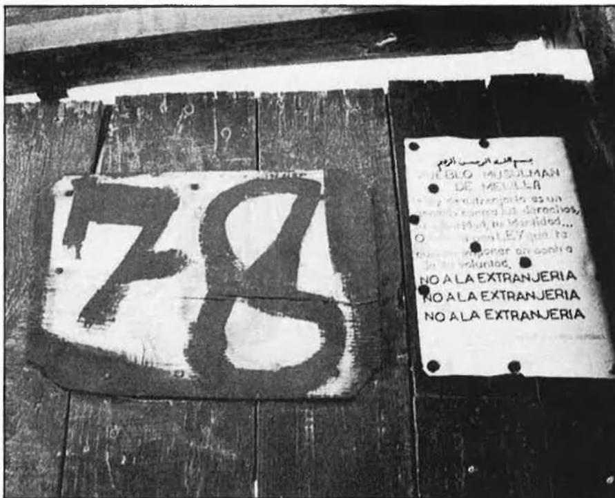
El conflicte al Marroc pot ser la clau de tota la qüestió.

Clar que això no vol dir que Ceuta i Melilla fossen permanentment espanyoles. Per ara, no ha calgut que cap soldat marroquí entrés a Melilla per situar aquesta ciutat en la condició de «fruita madura» que tant agrada com a definició a Hassan II. □