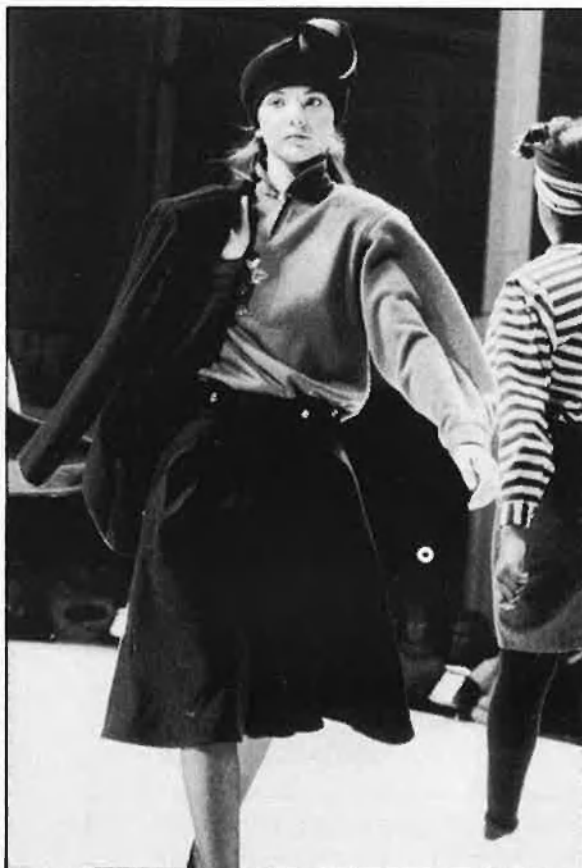
Dalt models de Tutti Fruti i Ramilans. Baix, Col·leccions d'Enguidanos i Lecca-Lecca.