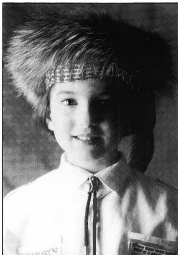
Una mostra de la col·lecció Petano: Canadà.