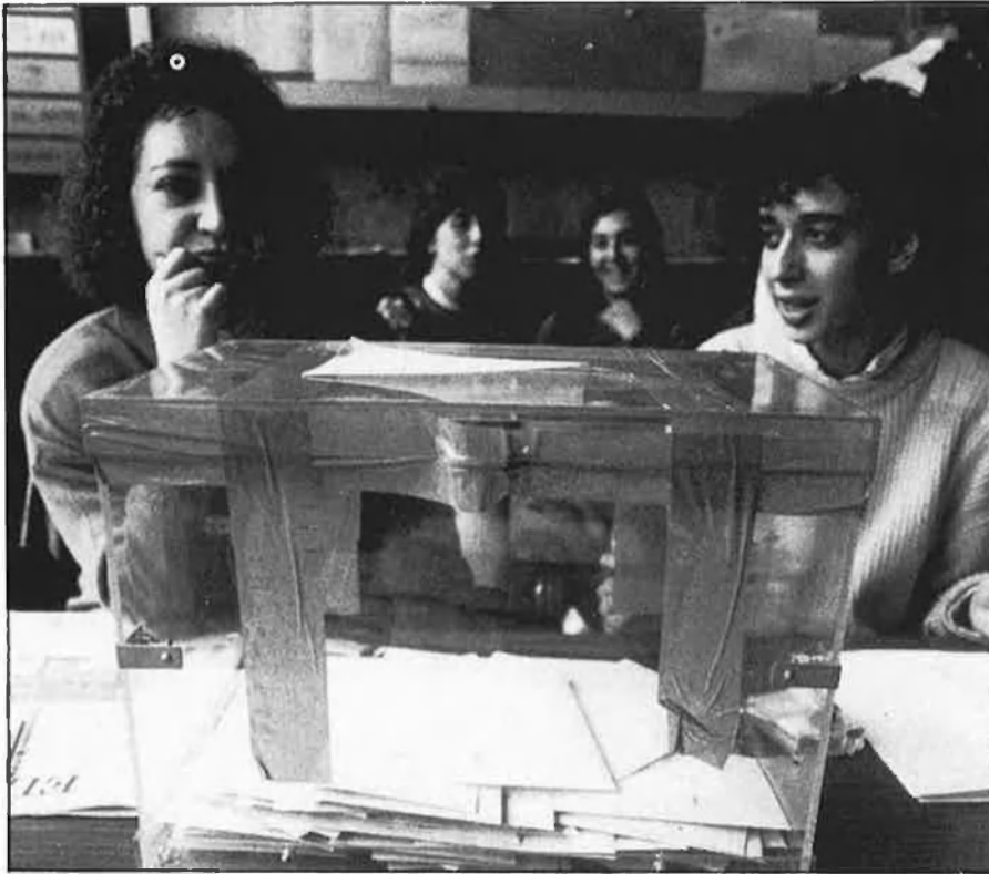
L'abstencionisme fou una de les característiques de la jornada electoral.