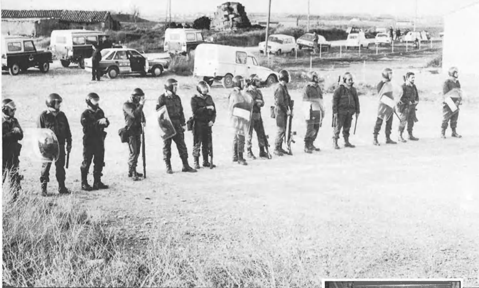
COLONS DE MONTAGUT: «NO ALS DESNONAMENTS»