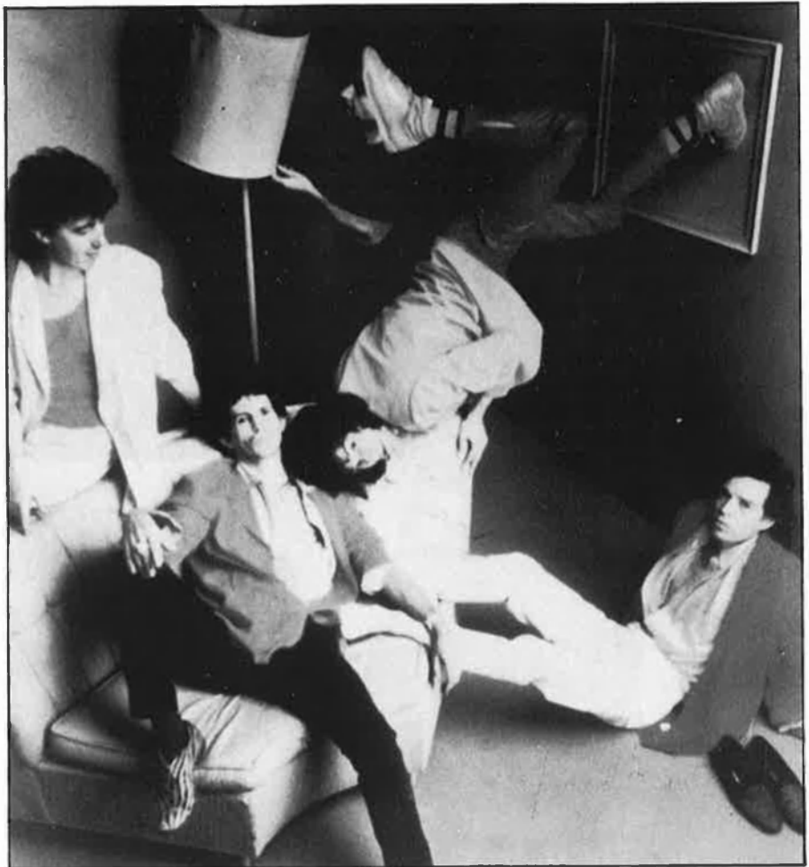
Dalt, els Stones. Baix, portades conflictives.

Des de Sevilla, el grup Veneno , l'estètica de la buleria antipsiquiàtrica, es reflectia en una portada que reproduïa una «postura» de xocolate encunyada amb el nom del grup. Són pocs els que tenen un exemplar d'aquesta edició, perquè de seguida la CBS la transformà ampliant-ne la barra d'haixix a les mateixes dimensions que la coberta. Un bon antídoto