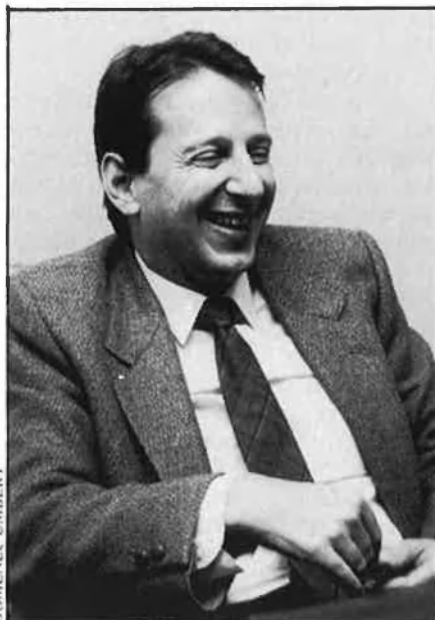
«Pel que fa a la llengua, tot crema».

—Sí, però els programes culturals tenen poca audiència. A França en tenen més, perquè la literatura és l'esport nacional.