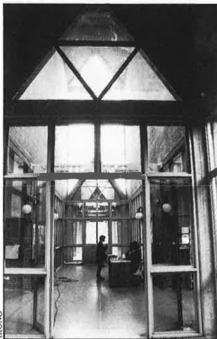
Dalt, Conselleria de Cultura de la Generalitat valenciana. A la dreta, manifestació a Barcelona.

Com a contrapartida, anuncien per a aquesta mateixa setmana mobilitzacions que serviran, en definitiva, per a mesurar si la seua representativitat és o no és la que s'atorguen. Si aquestes fossen importants, significaria un colp fort a la Conselleria de Cultura, Educació i Ciència, que no ha dubtat a qualificar les negociacions anteriors com a «molt destacables i mostra da-