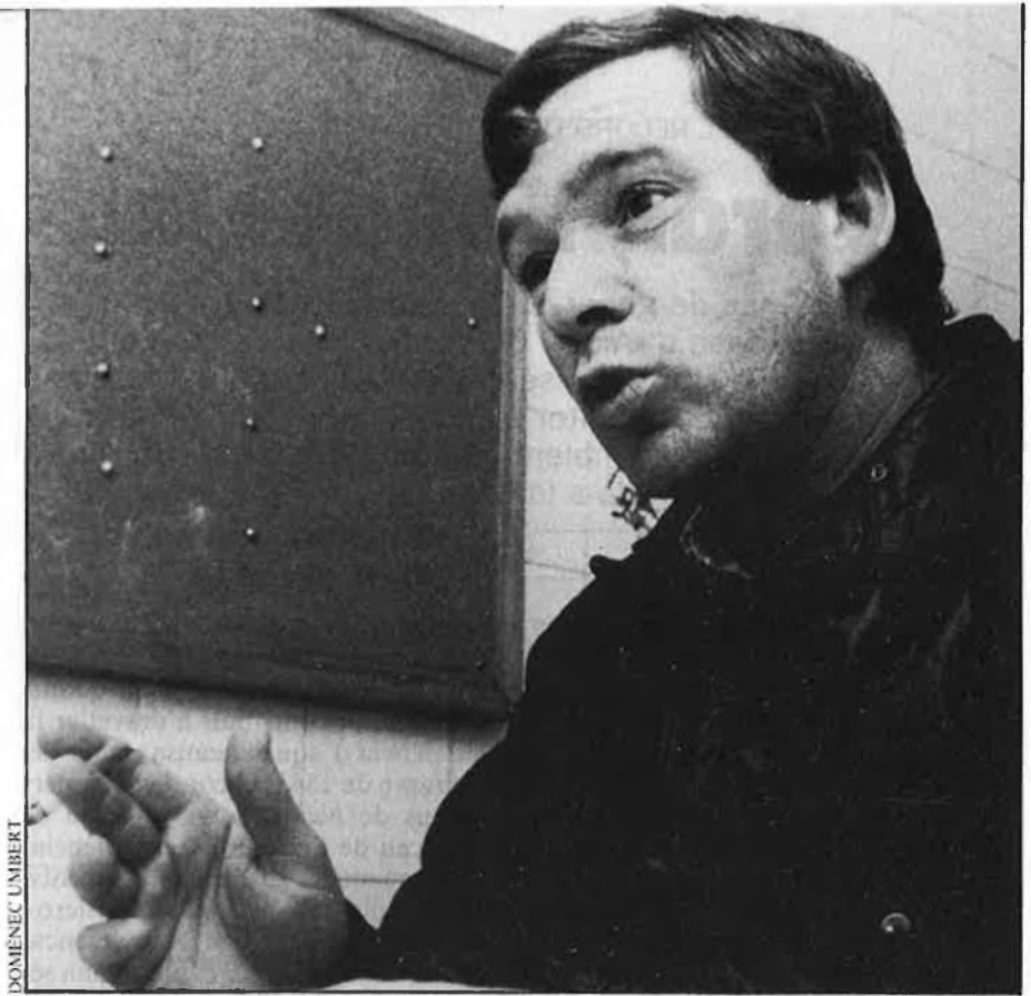
«Menotti és un demagog del futbol».