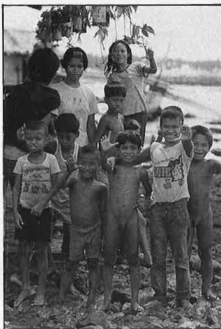
Xiquets àrabs del poblat de Malemíu, fent el signe de Cori Aquino.

Si el visitant vol conèixer de veritat les Filipines, farà bé d'acceptar l'ofertament de ser portat a un bar de «girls», per fer-hi una ullada: locals buits i immersos en llum vermella i música estrident. Les noies esperen assegudes a la porta els clients, filipins, o millor estrangers, que paguen més. Algunes no tenen encara quinze anys. N'hi ha que de dia van a l'escola i de nit fan la feina d'amagat dels seus pares, per guanyar alguns diners amb què comprar-se roba. D'altres ho fan, purament i simplement, per menjar l'endemà. La tarifa habitual —1.000 pessetes, una estona; 2.000, la nit— suposa uns texans, o uns quants dies de panxa plena.