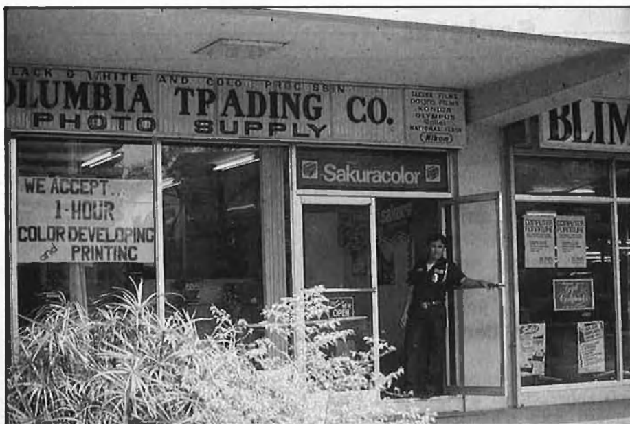
Botigues de Cebú. No n'hi ha cap sense el seu guàrdia de seguretat.

nàries de la guardarrobia d'Imelda Marcos i per sentir que el palau és, també, una miqueta seu.