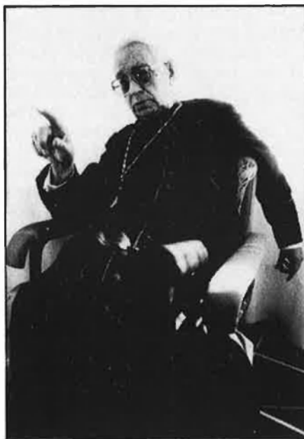
«Si em fan papa, m'hauria mort en cosa de dies».

guns problemes entre vostè i l'abat Escarré, entre vostè i Montserrat.