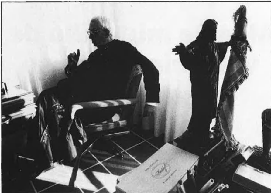
«Franco sabia que jo no era amic del règim, però que volia el bé de tots».

—És que, si diu una cosa, uns se li tiren damunt, i si en diu una altra, els altres... ¿Què hi podem fer? És una situació molt distinta a la de Catalunya. Jo tinc compassió dels que tenen