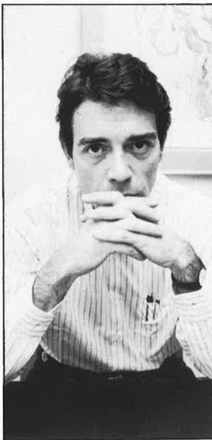
«Cada dia és com si comencés de nou».

—Pràcticament em passo tot el dia tancat al taller. El contacte amb els materials i les obres m'estimula i una obra em porta a l'altra. Això no vol dir que a vegades no em passi quinze dies davant d'una tela en blanc rumiant el que faré. Contra el que em pensava, l'experiència i els anys de treball no em donen cap seguretat i cada dia sembla com si comencés de nou. Cada matí, em fa autèntica bardsarda d'iniciar el treball, àbocar-me a l'abisme. M'he acostumat a prendre moltes notes, gairebé totes literàries, en un bloc que sempre porto al damunt. Idees que s'originen a qualsevol lloc. Algunes les realitzo i, d'altres, no. Les notes són com ordres que em dono a mi mateix: recordar