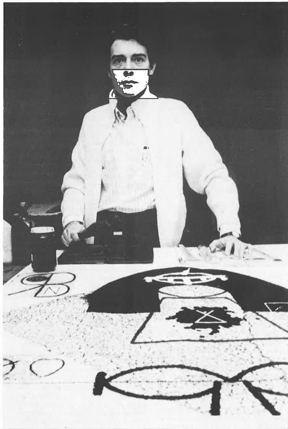
«A Catalunya, el suport institucional és inexistent».

pre que la creativitat s'adapti al tipus d'eina que és diferent al del cinema.