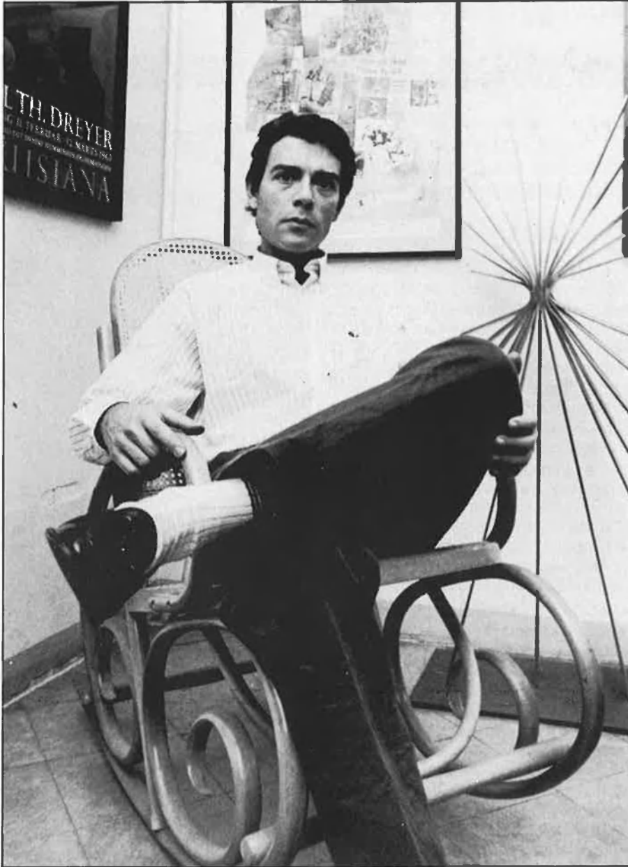
«Aquesta exposició és el resultat del diàleg entre instint i raó».

Per tant, cal llegir el llibre i intentar sintetitzar. Alguna vegada, puc donar molt veladament la meua opinió sobre l'obra, un llenguatge pictòric. Amb El Mall vaig fer seixanta o setanta portades. Aquest any n'he fet unes set o vuit per a editorials diferents.