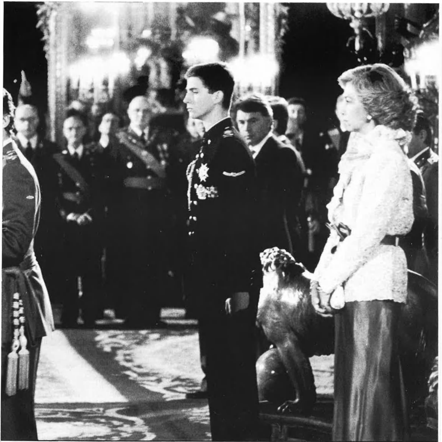
Dalt, Pasqua Militar. Baix, el model F-18.