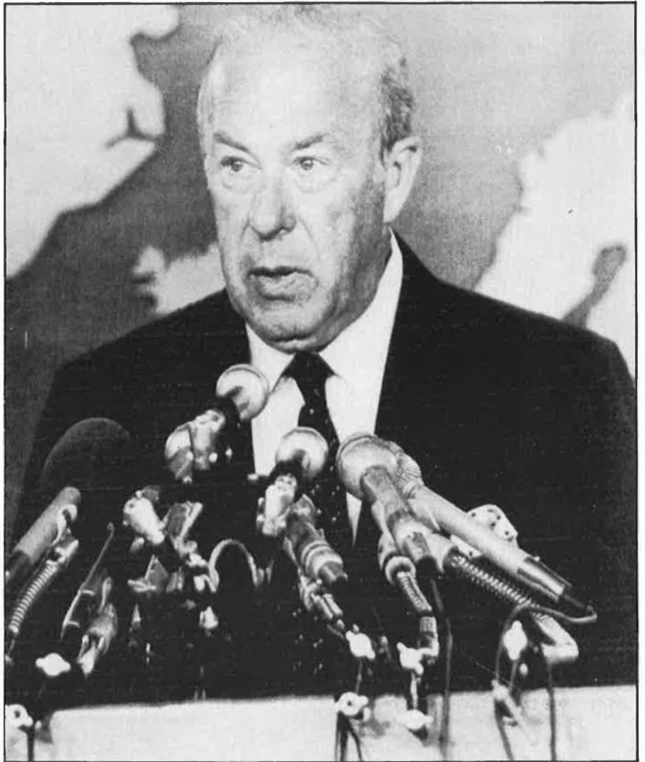
Shultz i Washington volen quedar-se les bases operacionals.

El Consell de l'Atlàntic Nord compta amb un comitè de Plans de Defensa en el qual participen tots els països amb forces militars «directament OTAN».