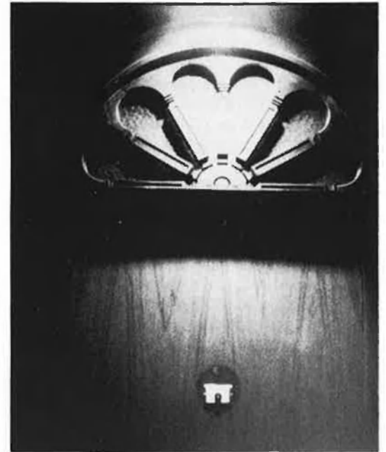
A l'esquerra, Sombres , un lloc típic a porta tancada. A la dreta, un altre club amb semiprivat.

Estudio 17 , prop de la plaça Redona, reuneix un públic especialment juvenil. Marietes teen-agers en febre de