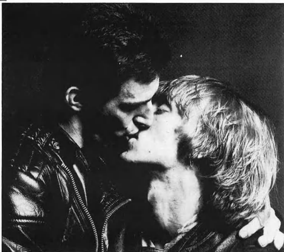
A l'esquerra, Estació d'autobusos. A la dreta, Balkiss, llocs habituals de contacte.