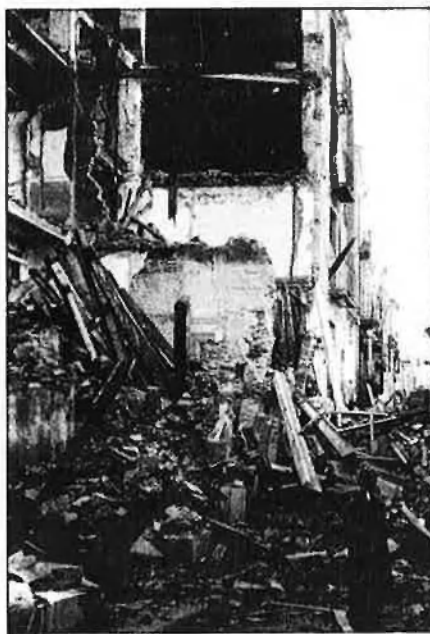
La desmoralització de l'enemic: Objectiu principal.

Pel que fa a les incògnites que queden per aclarir, els dubtes encara romanen sobre qui va protagonitzar els bombardeigs de Granollers i de Lleida. «Se sospita dels alemanys, en tots dos casos, però encara no ho hem pogut confirmar». A Granollers el bom-