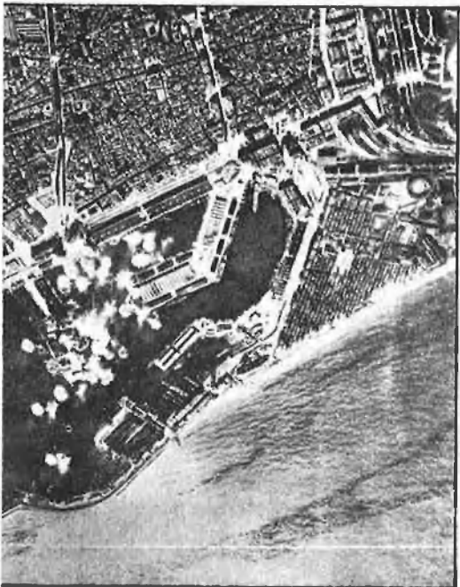
Imatges dels bombardeigs des dels avions.