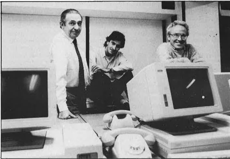
«AVUI»-«DIARI DE BARCELONA»