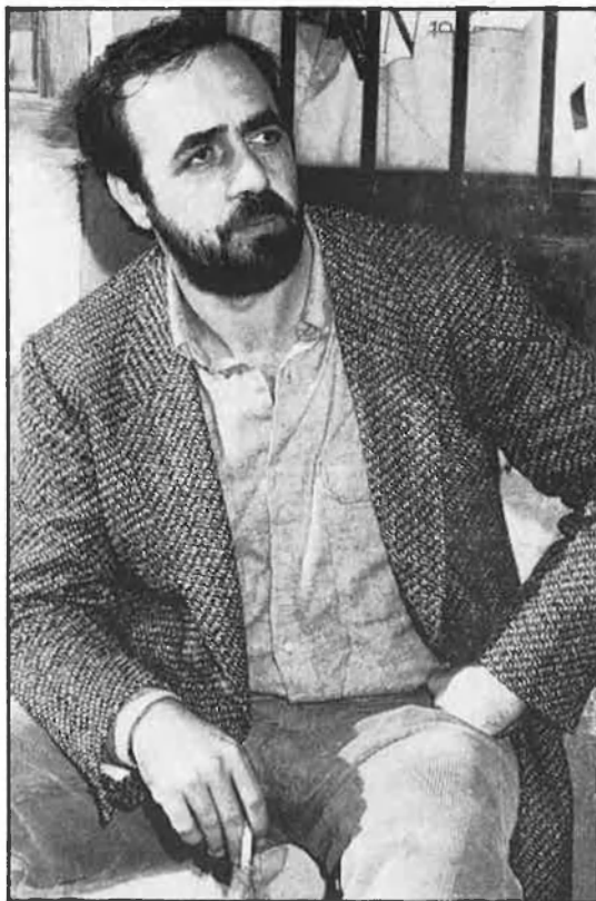
«Si el dolor és terminal, no té cap sentit passar-lo».

—Continúe fent de metge, com sempre. El meu cap és la medicina integral, que entén l'individu com una unitat, sense seccions ni especialitzacions. Tractant d'emprar en la mesura en què siga possible les teràpies «toves», dins d'una jerarquia de teràpies que van des de la cirurgia fins al consell, el massatge o la conversa... tot posant a disposició de la gent tota la gamma possible, i des de la convicció que la funció de la medicina no és lluitar contra la malaltia, el dolor i la mort, sinó acompanyar la gent a viu-