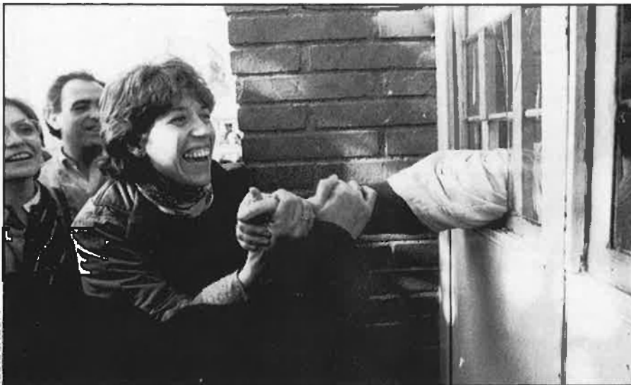
Alliberament de manifestants pro-dret a l'avortament a Barcelona.