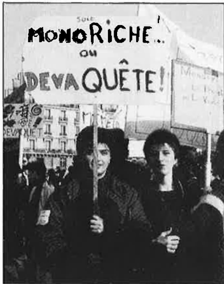
Manifestació a París.

litzacions de maig del 68. Contra aquest model, actualment en funcionament, la dreta intentava la implantació d'un model universitari a l'americana amb l'existència de centres elitistes, òbviament cars, i de centres normals («degradats», segons la terminologia estudiantil) adreçats a