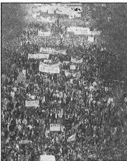
Després de les mobilitzacions, retirada de la llei.

tudiants no volgueren conformar-se amb la retirada de la llei.