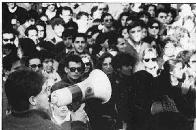
VOLUNTAT DE RECUPERACIÓ, RECUPERACIÓ DE LA VOLUNTAT