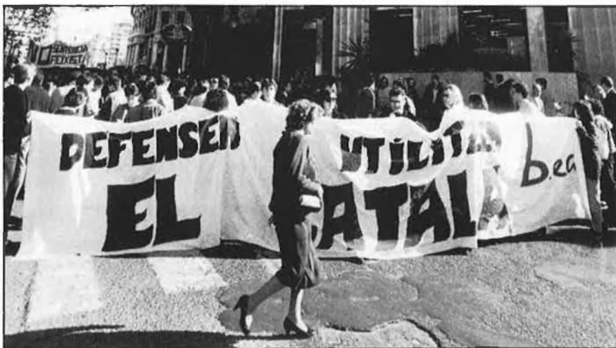
«Un procés que demana participació activa i decidida».

La manifestació, el dia 20, a les 6 de la vesprada, es concentrarà a la plaça de Sant Agustí i acabarà a la plaça de la Mare de Déu, a València. Els organitzadors voldrien que, a més del caràcter reivindicador, tingués un matis festiu. Mentrestant, cremen les línies del telèfon programant actuacions, contractant autobusos, distribuint paper. A la seua d'Acció Cultural cada dia que passa l'activitat va fent-se més i més febril i encara ho serà més. Escoles, instituts, bandes de música, pilotaires, associacions veïnals, partits i sindicats, colles futbolístiques, falles, centres excursionistes, grups ecologistes, patronats festers, una xarxa multiforme i desballestada que involucra tot el teixit associatiu de caire progressista d'aquest país, en major o menor grau, s'adhereix, participa o almenys rep informació de la campanya. Perquè «la normalització lingüística que reivindicuem és un procés impossible de se-