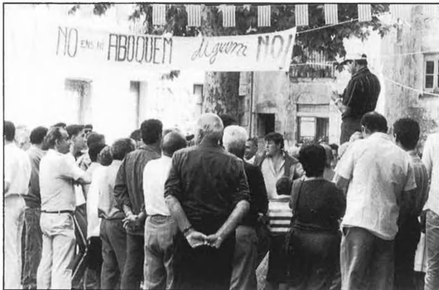
Besalú, plaça de la Vila.