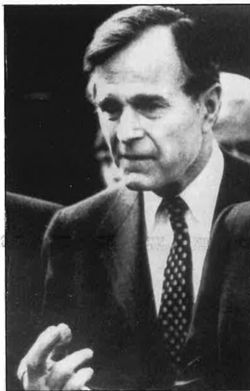
Reagan, amb Bush, al 81, quan el segrest

L'operació començà l'estiu del 1985 quan el ministre israelià d'Afers Exteriors telefona a Robert McFarlane per informar-li que elements «moderats» del règim islàmic iranià podrien estar interessats a entrar en contacte amb el govern nord-americà, per aconseguir material de recanvi per als seus avions i carros de combat de procedència americana. (Abans de la revolució khomeynista, Iran posseïa el més complet material