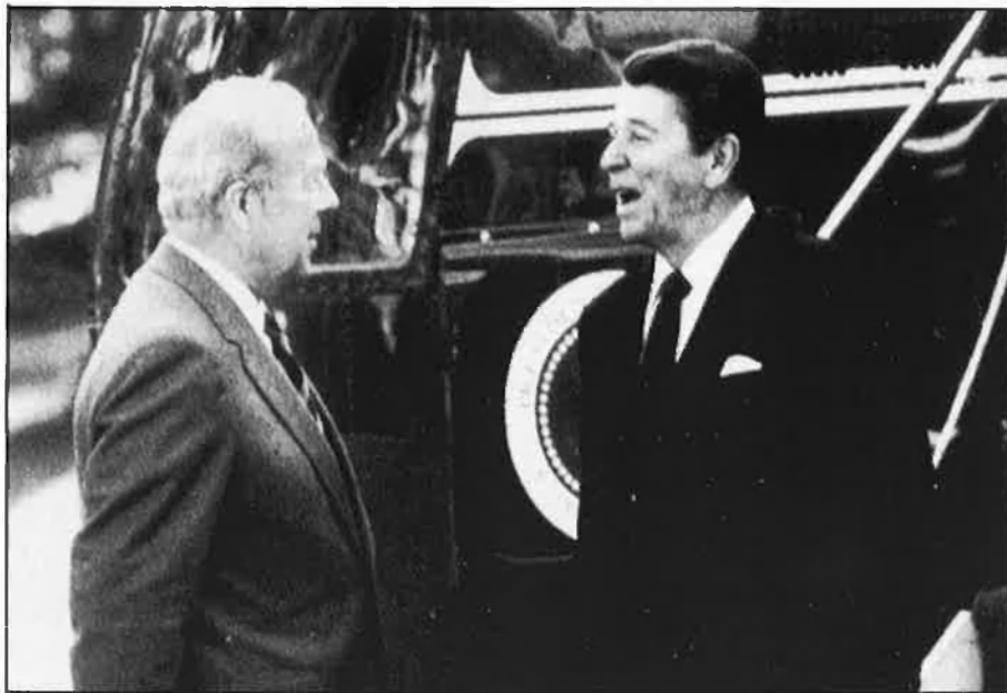
Reagan amb Shultz.

Aquesta actitud és la que deixà sol, rere les cortines de la Casa Blanca, Richard Nixon i el conduí a l'helicòpter final aparcat als jardins del 1600 de Pennsilvània Avenue. Aquesta és també l'actitud que està deixant sol Ronald Reagan i que podria portar-lo a prendre el mateix helicòpter, al costat d'una Nancy, vestida de roig, que preguntarà «¿per què Ronnie?», mentre veu allunyar-se Capitol Hill i la seua Casa Blanca. □