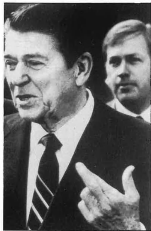
Reagan, amb Bush, al 81, quan el segrest d'ostatges nord-americans.

Al novembre, míssils EUA de la classe Hawk arriben a Teheran a través d'Israel. Caspar Weinberger comença a preparar el noliejament de vaixells per traslladar la part més pesada de material a l'Iran. El president Reagan signarà al mes següent una ordre secreta autoritzant la venda de les armes transportades per determinats vaixells al règim islàmic de Teheran. La primera càrrega «legal» arriba al febrer. Al maig, McFarlane i North viatgen a Teheran (McFarlane disfressat de mecànic), per tal de mantenir converses amb membres de l'exèrcit iranià. Quan Khomeyni se n'assabenta prohibeix als seus militars parlar amb els enviats de Reagan. Tot i això, sembla demostrat que la iniciativa dels contactes amb Washington partí del mateix ayatollah . Als israelians, per la seua banda, els interessa mantenir encès el foc de la guerra al golf Pèrsic, paralitzant així dos enemics potencials de pes. I no és cap secret que Tel Aviv sempre està disposat a tirar una mà al seu protector nord-americà.