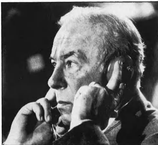
Reagan i Nancy, inefable. Baix, Shultz: «Jo no en sé res».