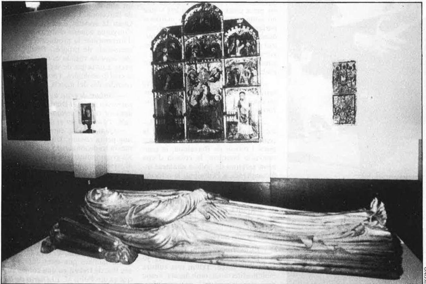
Una exposició magnífica, amb la dignitat que el Misteri es mereix.

país, la imaginària pròpia del muntatge —treball de mesos— anava sent emmagatzemada als locals de la Conselleria de Cultura. Restarà allí. Fins el mes de gener, en què serà traslladada a Barcelona, on l'exposició serà exhibida de nou.