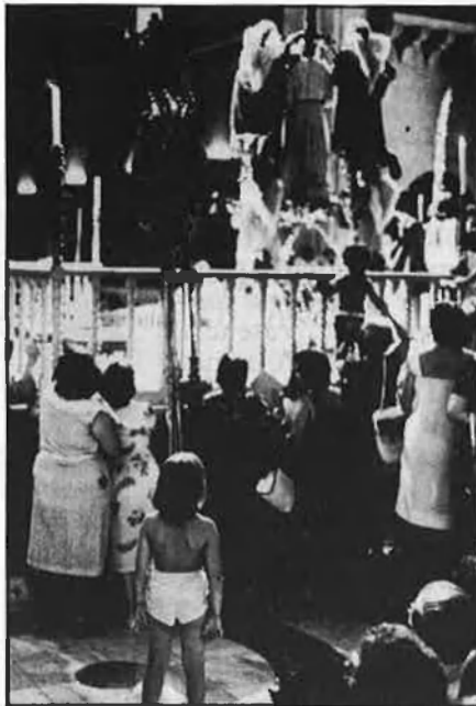
Dalt, un moment de la festa. A l'esquerra, detall de l'exposició realitzada a la Llotja.

El ressò que la iniciativa i les activitats que l'envolten ha tingut i tindrà a la ciutat d'Elx ha estat, com és obvi, extraordinària. I és que el Misteri, fins i tot allí, era desconegut en molts dels aspectes, sobretot pel que fa a la