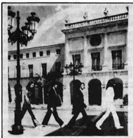
Els Beatles, davant l'Ajuntament de Gandia: «Res no és real».