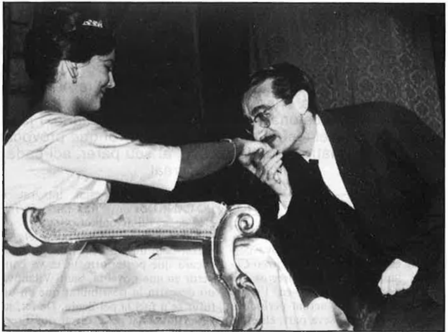
Fuster als premis Ausiàs Marc, afectuós.

Els resultats, doncs, llibres, revistes, teatre, catàlegs, ràdio, una mica de música i de vídeo, alguns híbrids novedosos, molta gent involucreada, una societat creixentment receptiva. Però tot això no és el model saforenc, si de cas només és el producte. El que hi ha és una xarxa de bars, cafeteries i cases de bon estar amb taules propícies per a la tertúlia i una gent amb oficis diversos, però harmonitzables, que fan el barret mentre juguen al truc o lliguen mentre