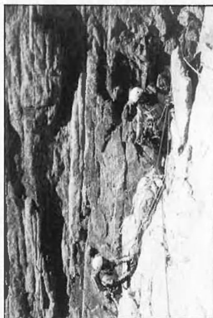
Quaranta anys de CEV, una llarga i difícil excursió.

dem trobar membres de qualsevol ideologia. Pesa, és clar, la pròpia tradició, valenciana i progressista. D'altra banda, l'esport de l'excursionisme estimula l'interès per conèixer la realitat i els problemes d'un país que, a ciutat, es difumina massa».