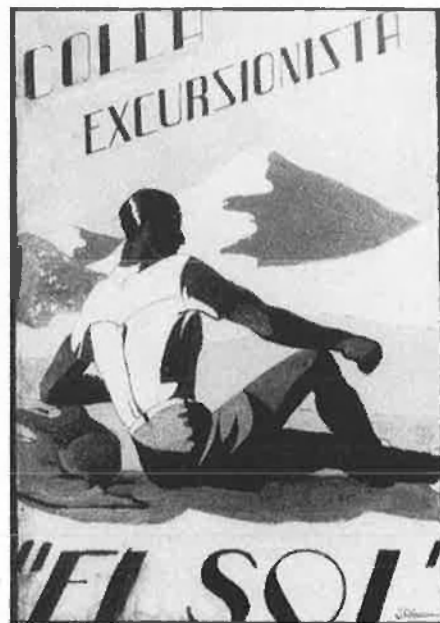
Colla El Sol, el procés cap a la fundació del Centre.

Els inicis foren difícils. Seguí a la guerra un llarg període de desorientació. L'excursionisme era, atesa la seua tradició, un moviment suspecte per al règim. A la fi, l'any 46, a Sant Esperit, tingué lloc l'acampada fundacional. Les condicions no eren ni de bon tros les millors per fomentar el coneixement del país i la vida a l'aire lliure, però els cent membres inicials saberen trobar la necessària continui-