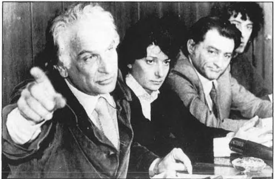
Marco Pannella: el gran repte.

el 1976 els radicals entraren per primera vegada al Palau de Montecitorio, seu del Congrés dels diputats italià, amb quatre parlamentaris, entre els quals hi havia Adele Faccio, trajectora d'Espriu a l'italià. Aquesta