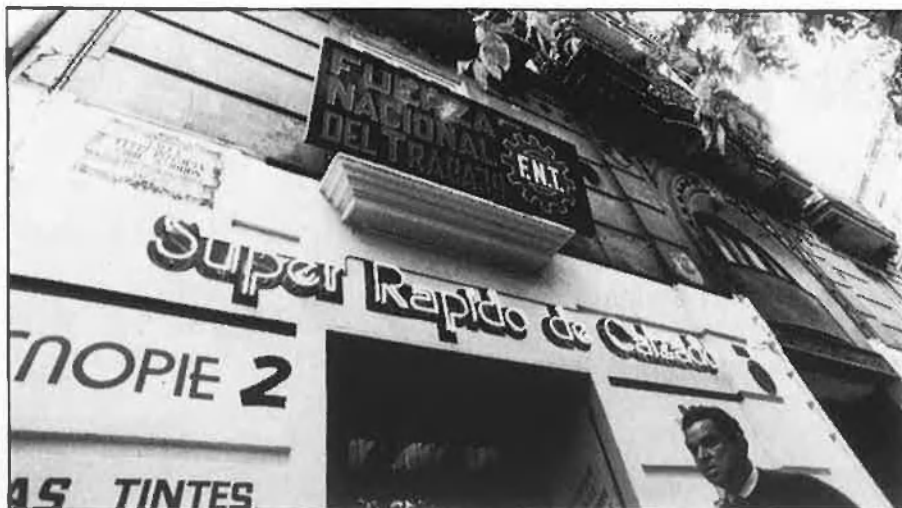
A l'esquerra, manifestació a València. A la dreta, local de FNT en aquesta ciutat.

de grups feixistes o nazis de l'Alemanya Federal i sobretot, del seu homòleg i mestre, l'FN francès.