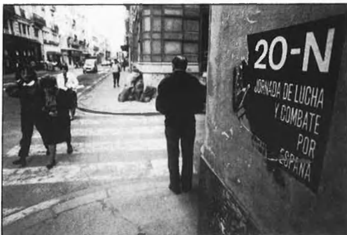
Cartells pro-20-N, a València. Baix, seu d'Unión Hispana en aquesta ciutat.