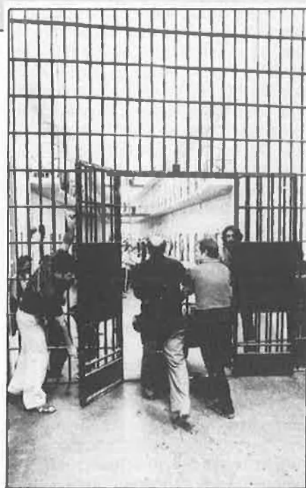
«Les estades en presó han agreujat la psicopatologia del malalt».

lla. El pagament de les fiances ja no és excusa per sortir de la presó i Jordi, amb 22 anys, ingressa definitivament a la Model, amb dues condemnes,