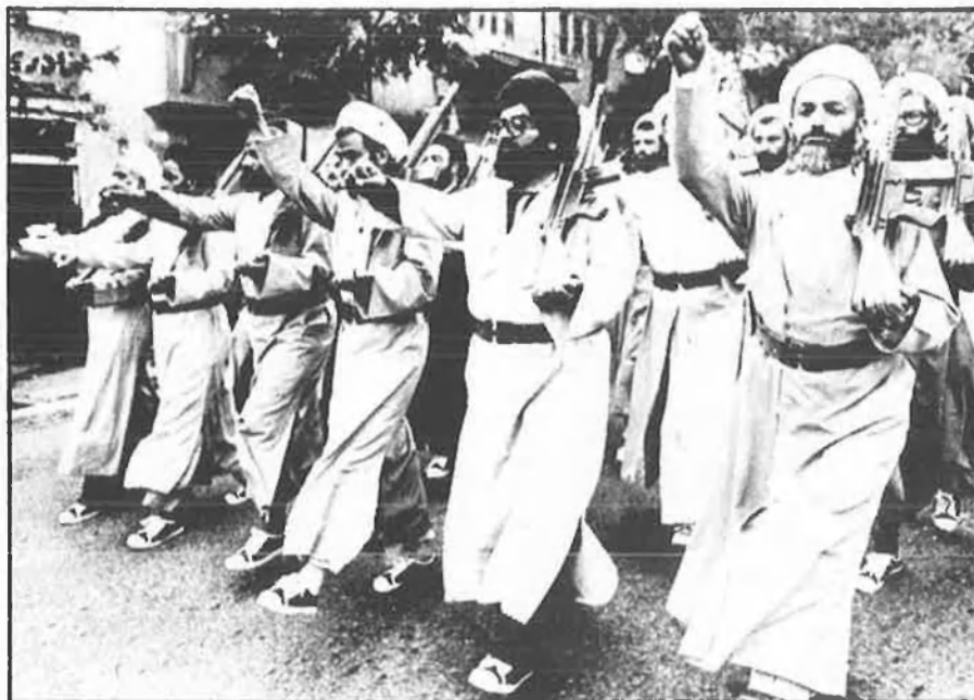
La violència organitzada, patrimoni de tots.

Hi ha, després, les que es definien com a guerres civils. Exemple patètic: el Líban. No es fàcil, però, conservar unes característiques independents ni en aquest cas: darrere dels falangistes hi ha sovint els israelians, Síria ocupa —ni que siga com a força de control— bona part del territori, els palestins potser no tindran estat, però tenen exèrcit i el Líban, en qualsevol cas, no és el seu estat. En les que abans anomenàvem guerres civils està produint-se, a més, un fenomen preo-