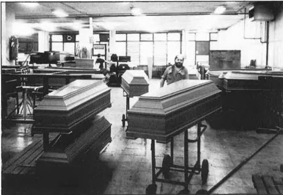
La producció de taüts arriba als 20.000, amb distins models.

des de les 70.000 pessetes fins les 300.000 que val el servei més car: «arca forma americana de fusta d'importació, llisa, envernissada amb polièster i laca satinada, entapissat capitoné, creu de metall damunt la tapa, nanses bronzejades tot a l'entorn del taüt, pany i lletres. Cotxe fúnebre número 7», es pot llegir en el catàleg.