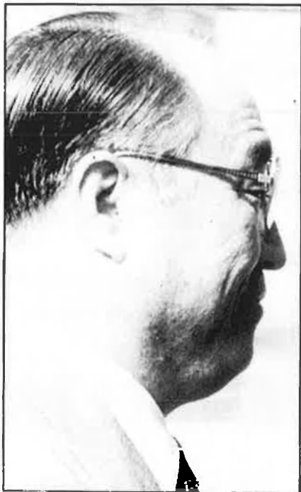
Sun Myung Moon, el gran ideòleg.