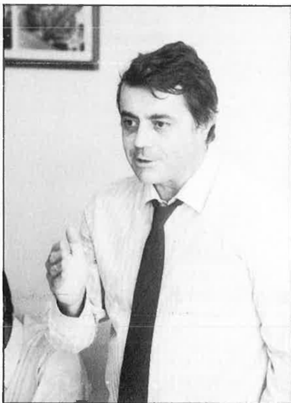
«Jo defenso una organització galleguista».

—Seria prematur parlar de compromisos concrets, tot i que hi ha una expressió que sent cada dia: «agora sí» (ara sí). Molta gent, entre la