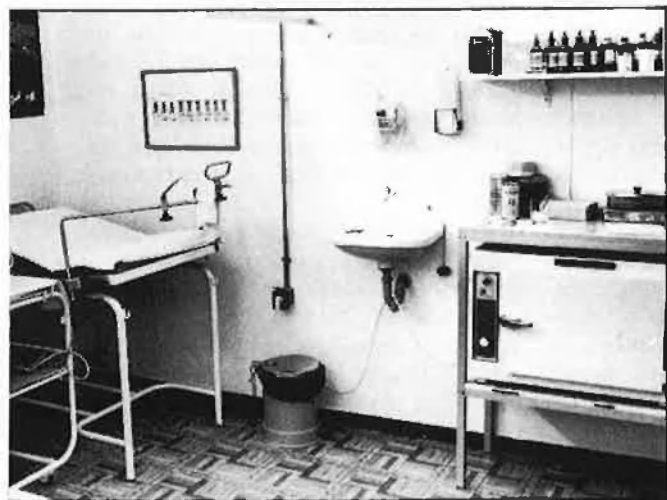
Dalt, el president Lerma rep tres dones encadenades pro-avortament. Baix, manifestació a favor de l'avortament i centre de planificació familiar.

L'endemà vaig anar amb una amiga. Encara no li ho he agraït prou. Hi havia ben bé deu dones esperant-se pel mateix; així, em tocà esperar dues hores, que es feren eternes. Una xica d'allí ens explicava mentrestant tot el procediment, tractant d'animar-nos, però allò semblava un vetlatori. Hi havia dones grans, i xiques més joves, algunes acompanyades pels seus amics, o marits, i altres amb amigues. Quan em tocà el torn, les cames em tremolaven. Vaig haver de veure, abans que m'ho fessen a mi, com ho feien a una altra dona. El cas és que aquella dona, d'uns trenta-cinc anys, es veu que havia parit feia poc de temps, i pràcticament ni s'adonà de res. A tot això, he de dir que no ho feien amb anestèsia, sinó a pèl. Ells deien que no era tan dolorós, i que, a més, havien observat que patir una estona ens ajudaria a assumir millor les conseqüències psicològiques de l'avortament... Però crec que el que passa és que temien que algú no li pegués malament l'anestèsia, ja que no hi havia cap mena d'equipament per a una urgència, i és obvi que ni ells ni