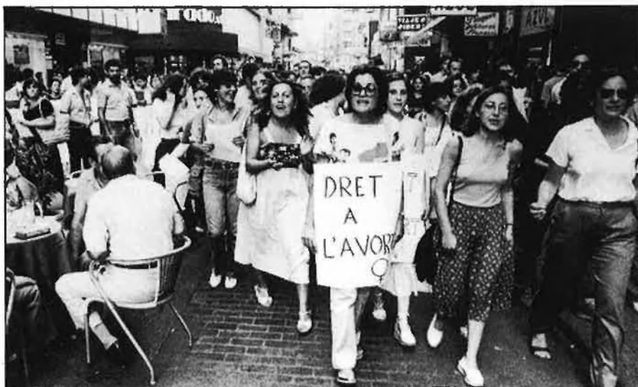
15.000 avortaments il·legals, al País Valencià, enguany...

Provaren amb mitja dotzena de cànules, el metge tot suat, i jo arrapada a la ma de la meua amiga, que també estava marejant-se. A la fi, una entrà, i connectaren com un petit aspirador, una bomba automàtica. Només eixia sang, és clar. Jo temia que isqués alguna altra cosa, però és que tot era sang, i no gaire. El metge no tenia massa clar que hagués eixit tot. Provà de nou amb una altra cànula. 'És molt difícil saber si ha eixit tot, quan s'està de tan poc temps', deia. Ja feia ben bé mitja hora, i em queien les llàgrimes de dolor. Al cap d'uns minuts, considerarà que ja n'hi havia prou, i em va desconnectar, i descanular. Va dir-me que tornàs sis dies després, per tal de fer-me una revisió. Ja que no estava segur d'haver-m'ho tret tot. I em donà el telèfon de sa casa, i una recepta d'un antihemorràgic. 'Si veus que sagnes més del que toca en una regla forta, crida'm o vine ací'. No em deixaren quedar-me ni un minut sobre la llitera, perquè n'hi havia una altra es-