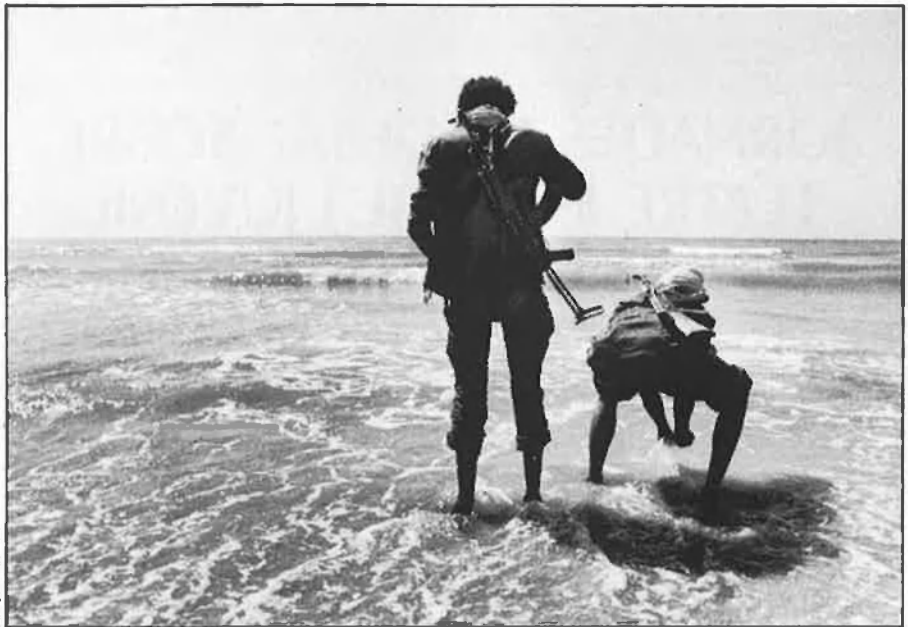
«En aquesta guerra és impossible una victòria militar.»

equip governant als compromisos i les responsabilitats assumits per l'Estat espanyol amb el poble saharià no responen en absolut amb la voluntat de milions d'espanyols que votaren el PSOE.